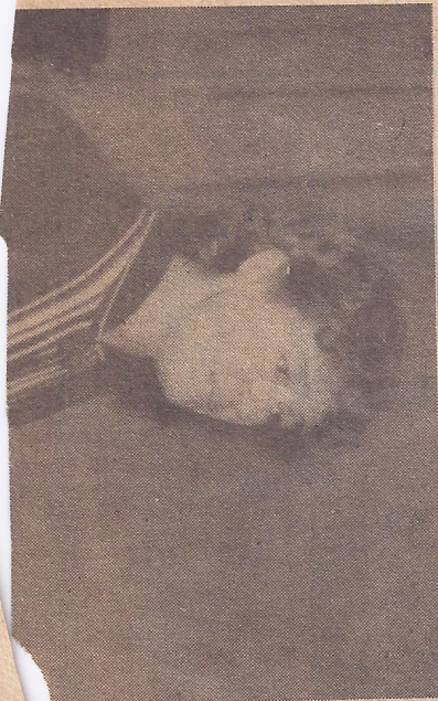
Слово про колегу

перше їзди. на апс теплій чоботи потріб ли там ли про мі ло торгівл сюди і товар тварин Не їх під ників гард». найпер запити цього Неп ки при пах « ровсь