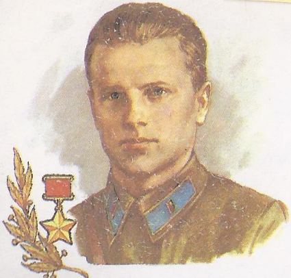
Герой Советского Союза капитан М. И. ВИНУРОВ • 1913—1943

Герой Роданского Союза капитан М. И. Виноуров