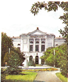
ТОМСК. Государственный университет имени В. В. Куйбышева