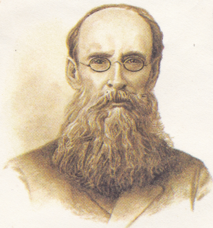
Украинский писатель Панас МИРНИЙ • 1849 — 1920